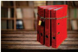
Dane osobowe pracownika powinny być chronione

Pracodawca może bez zgody pracownika wykorzystywać jego dane osobowe (imię i nazwisko, służbowy adres e-mail, służbowy numer telefonu), o ile informacje te są ściśle związane z życiem zawodowym pracownika. Ulega to zmianie dopiero w momencie, w którym współpraca na linii pracodawca – pracownik dobiega końca. Wówczas przełożony traci podstawę prawną do wykorzystywania danych osobowych byłego już podwładnego (chyba że ten wyrazi zgodę na ich dalsze ujawnianie). Ale okazuje się, że i bez